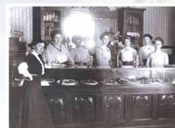
Selskapets medarbeidere i restaurantlokalet tidlig på nittenhundretallet