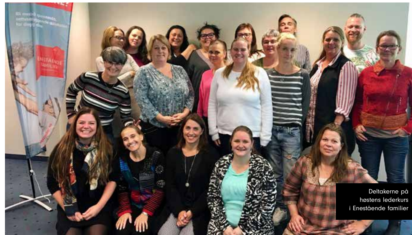
Deltakerne på høstens lederkurs i Enestående familier //